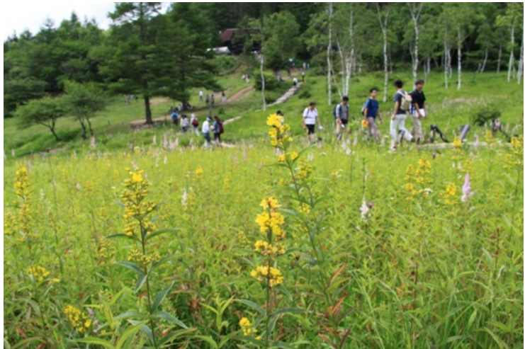
花の畑を歩いている人々